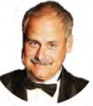
Marshall Button Théâtre Capitol