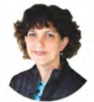
Lisa Paschal J.D. Irving, Limited